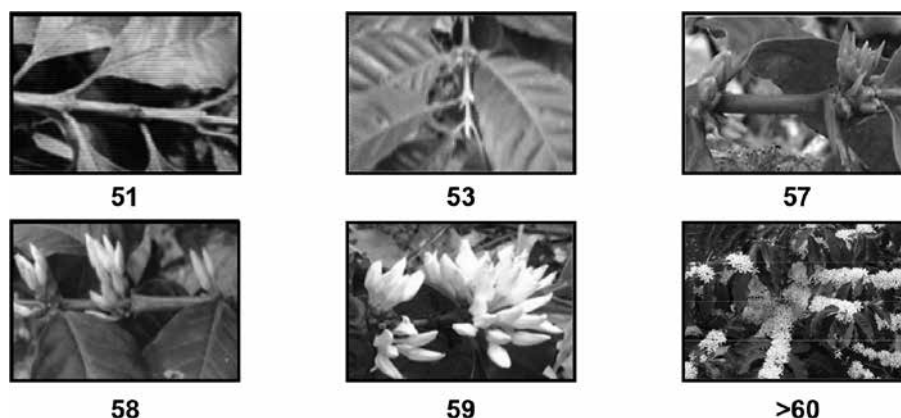
Figura 1. Estadios fenológicos del desarrollo de la inflorescencia del café var. Catuaí Rojo, en San Agustín, Caripe, Monagas.

Los valores de insolación estuvieron por debajo de 30 horas luz semanales, siendo considerados bajos y por encima de estos se estiman como valores altos